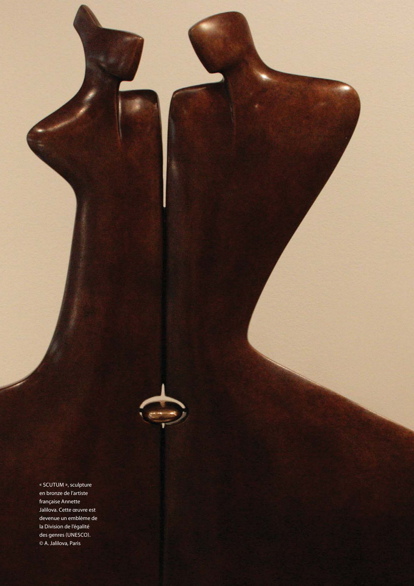
« SCUTUM », sculpture en bronze de l'artiste française Annette Jalilova. Cette œuvre est devenue un emblème de la Division de l'égalité des genres (UNESCO). © A. Jalilova, Paris