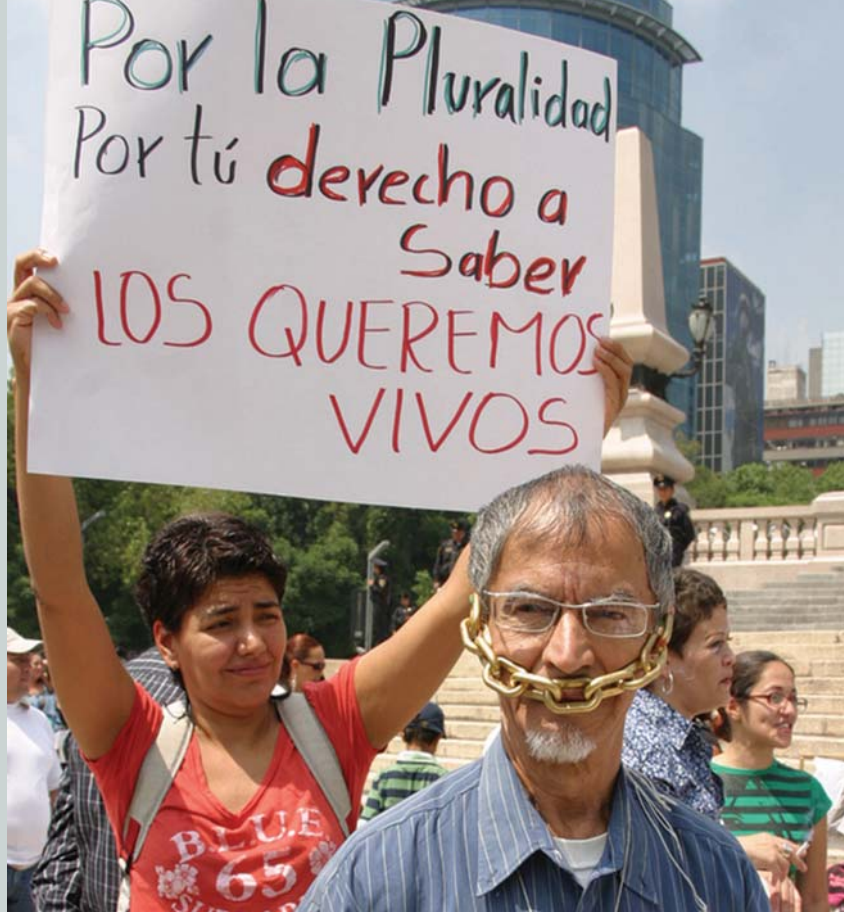
📍 Mexico : journalistes protestant contre les attaques et les enlèvements dont ils sont victimes.

Le second danger vient des gouvernements autoritaires qui, bien qu'ils soient arrivés démocratiquement