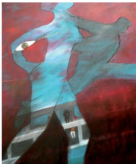
« Ahi vamos » (C'est comme ça), acrylique sur toile. Œuvre de l'artiste colombienne Mercedes Uribe. © M. Uribe

Le numéro AVRIL-JUIN 2011 sera consacré aux femmes à la conquête de nouveaux espaces de liberté.