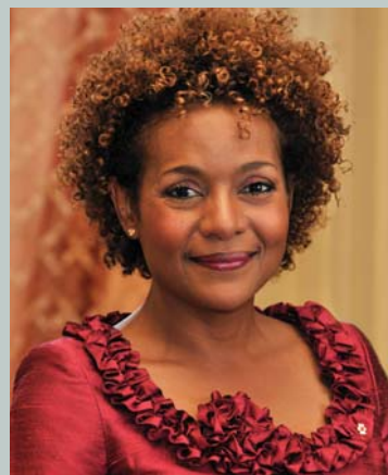
Michaëlle Jean, Envoyée spéciale de l'UNESCO pour Haïti.

Michaëlle Jean , née en 1957 à Port-au-Prince (Haïti), s'est exilée avec sa famille au Canada en 1968, fuyant le régime dictatorial de François Duvalier. Après une longue carrière dans le journalisme (réseau français de Radio-Canada et réseau anglais de CBC Newsworld) et un parcours militant dans le domaine de la défense des droits des femmes, Michaëlle Jean a accédé à la fonction de gouverneure générale du Canada (septembre 2005 - septembre 2010). Le 8 novembre 2010, elle a été désignée Envoyée spéciale de l'UNESCO pour Haïti. Avec son époux, le cinéaste Jean-Daniel Lafond, Michaëlle Jean préside une Fondation qui porte son nom, consacrée à la jeunesse et aux arts.